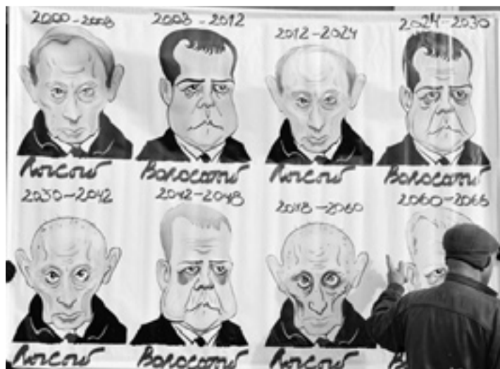
Фото: плакат с демонстрации в Москве.